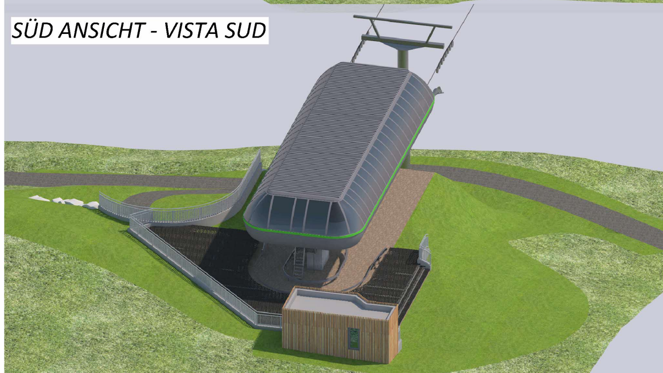
SÜD ANSICHT - VISTA SUD