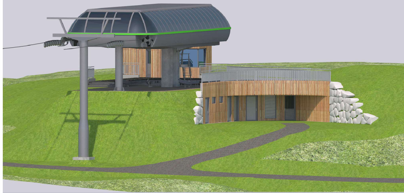
OST ANSICHT - VISTA EST