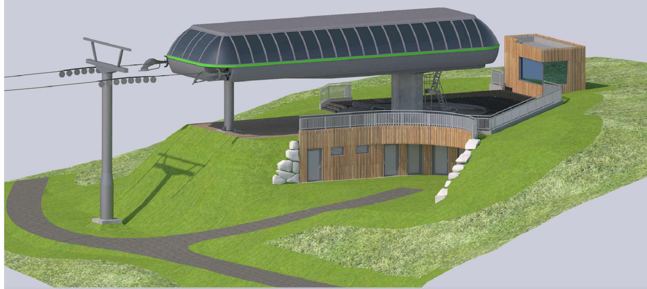
NORD-OST ANSICHT - VISTA NORD-EST