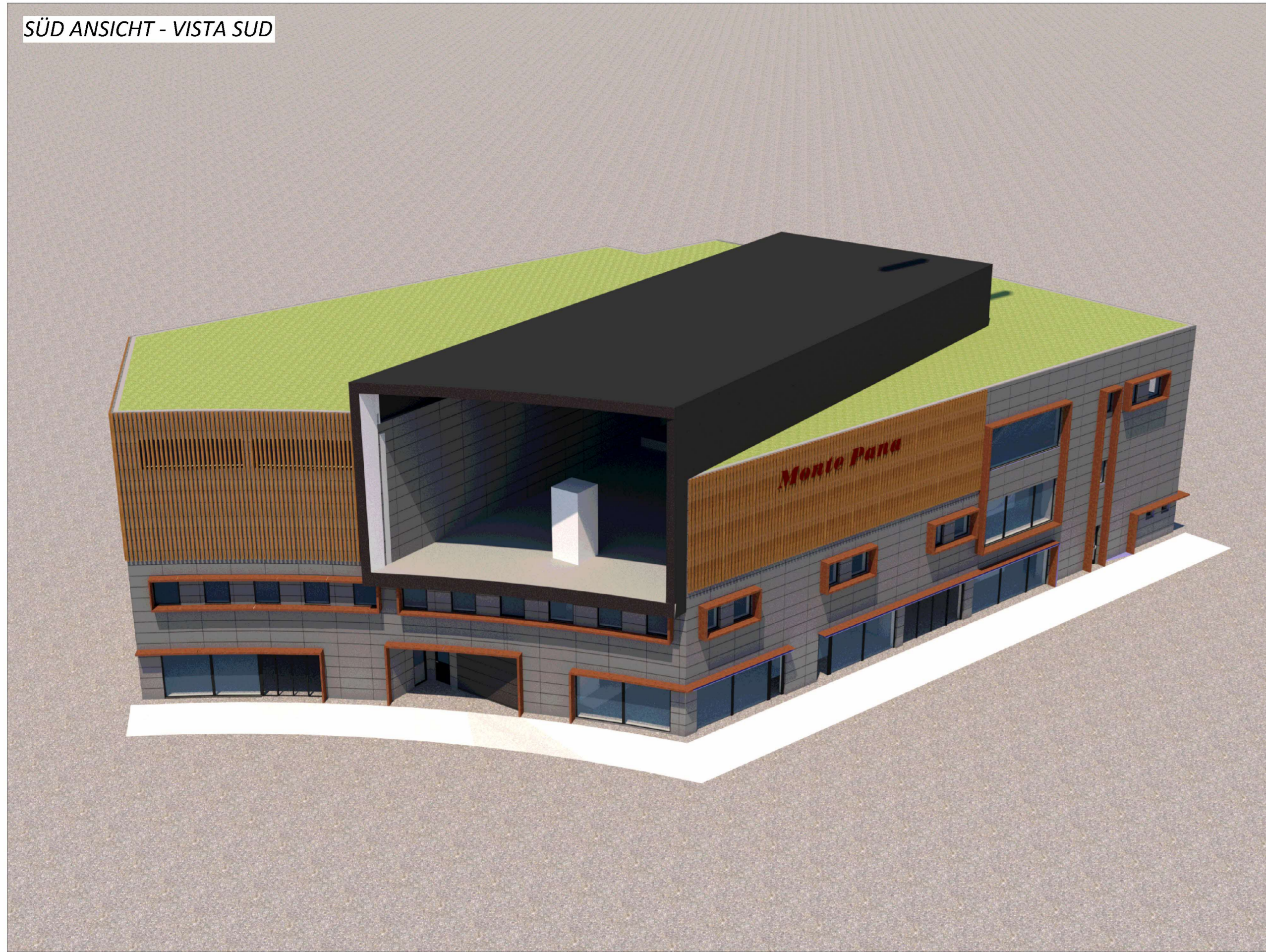
SÜD ANSICHT - VISTA SUD