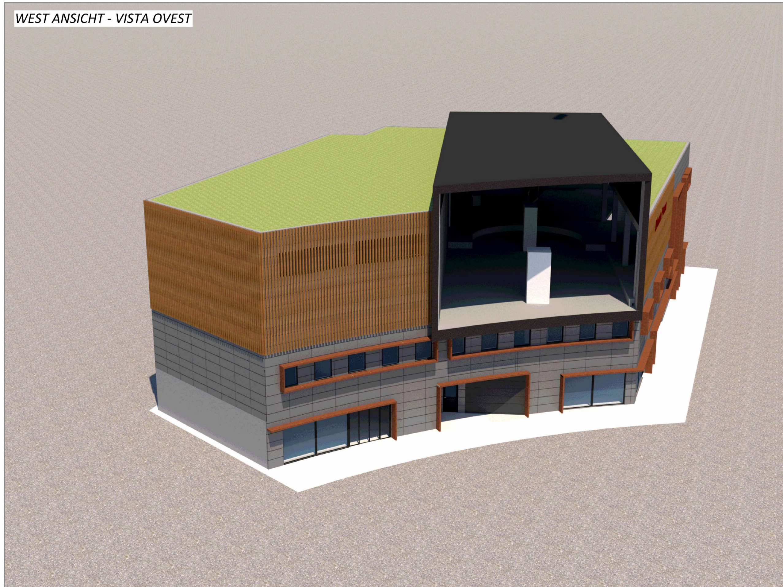
WEST ANSICHT - VISTA OVEST